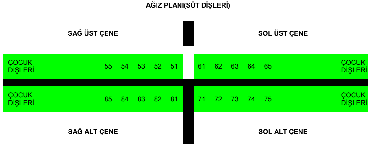
Tablo 2 : Çocuk diş şeması :

sagUstCene = _____ sagAltCene = E E E E E E E E solUstCene = _____ solAltCene = E E E E E E E E